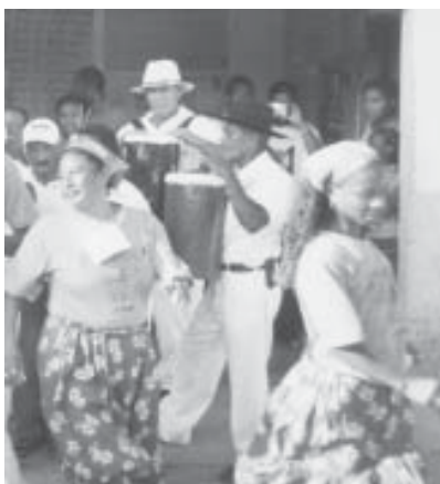
Jongo de São Benedito, Festival do Biju, ES.

Após quatro anos de discussão, o Instituto de Patrimônio Histórico e Artístico Nacional (IPHAN) aprovou, no dia 10 de novembro de 2005, o jongo como patrimônio cultural