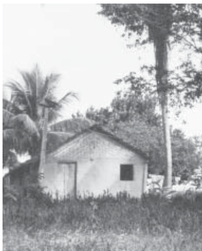
Comunidade Conceição da Barra, ES.