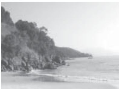
Praia Grande da Ilha da Marambaia, RJ

Em fevereiro deste ano, o Incra finalmente conseguiu, com uma autorização judicial, concluir os trabalhos de demarcação das terras quilombolas da Ilha da Marambaia.