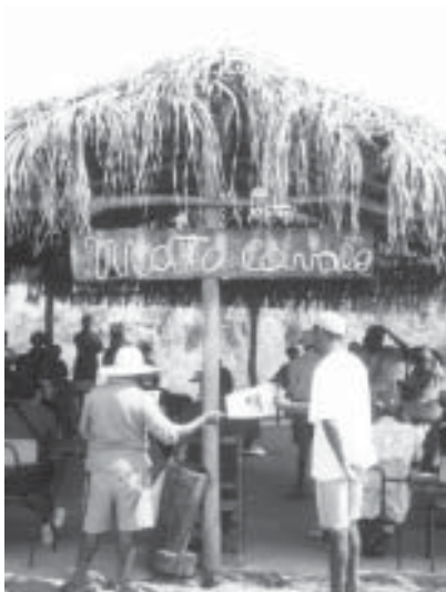
Comunidade Mata Cavalos, MA.

As comunidades também reivindicam informações concretas sobre a implantação, principalmente sobre os critérios para o cálculo do perímetro dos sítios.