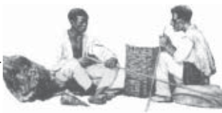
Fabricantes de balaio