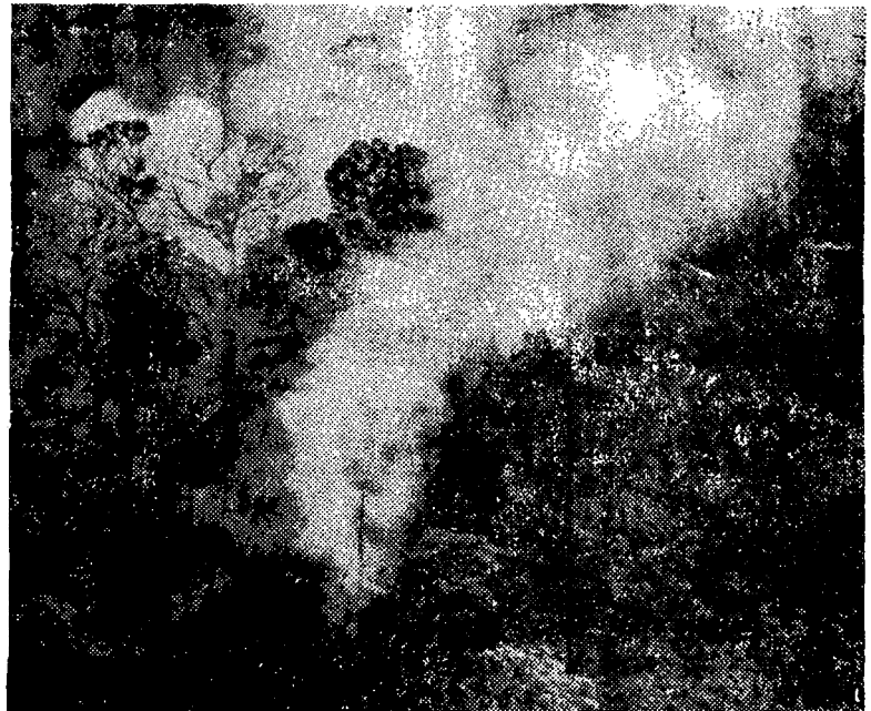
Um vasto patrimônio será convertido em cinzas antes mesmo de ser conhecido

A questão política crucial é a sua extensão. Pressente-se uma onda de reprovação sobre o país se elas se generalizarem. Intelectuais do mundo inteiro farão abaixo-assinados. Crianças mandarão quilos de cartas de protesto ao presidente Sarney. Índios serão convidados a congressos internacio-