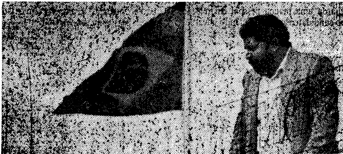
Lula diz que eleição se ganha na rua

O candidato do PT à Presidência da República, Luís Inácio Lula da Silva, cumpriu extensa agenda dia 8 em Aracaju (SE), de onde seguiu satisfeito com os resultados da campanha dos últimos dias pelo Nordeste, que incluiu as cidades de Fortaleza (CE) e João Pessoa (PB). "Quem vai para o segundo turno, eu não sei. Só tenho certeza de que a Frente Brasil Popular (PT/PSB/PCdoB/PV) vai chegar lá, contra a vontade de quem quer que seja", afirmou o candidato, otimista, ao desembarcar em Aracaju, às 8 horas 40 m.