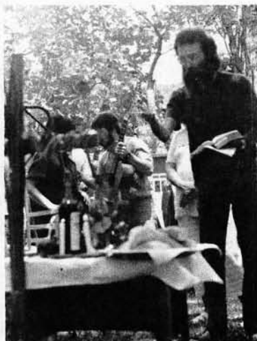
A celebração final envolveu os participantes