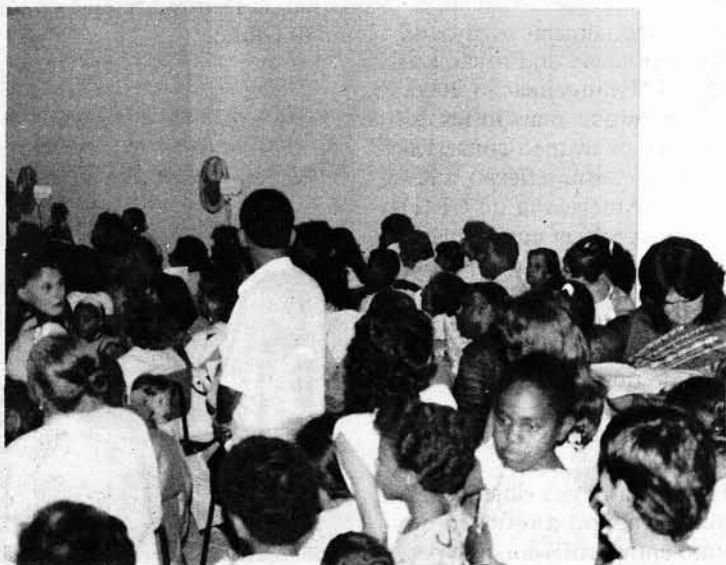
A festa tomou conta dos presentes à inauguração