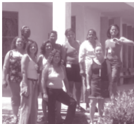
Grupo de multiplicadoras do Submédio São Francisco

As multiplicadoras do SMSF têm organizado encontros em diversos municípios, como Belém de São Francisco, Chorrochó, Rodelas e Petrolândia, em parceria com a Comissão Municipal de Mulheres Trabalhadoras Rurais. Nessas ocasiões elas procuraram oferecer informações necessárias para fazer o planejamento familiar, para cuidar da saúde da mulher e para a prevenção das doenças transmitidas através do sexo, como a Aids.