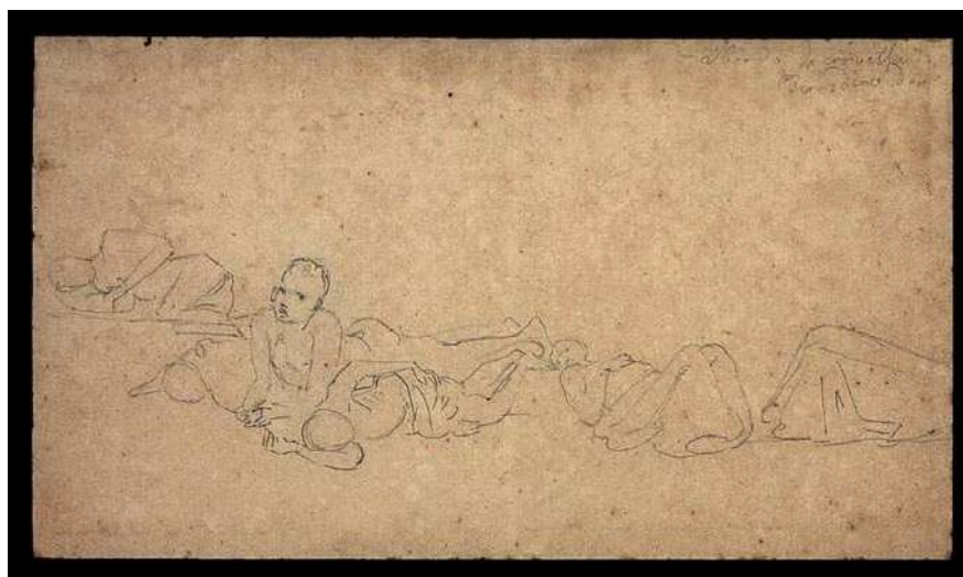
A bordo da corveta Bernardino Sá. Rugendas