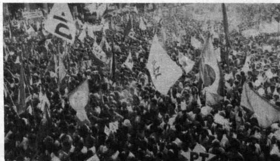
Diferentemente de algumas igrejas pentecostais, a Igreja Católica procura a neutralidade nas disputas eleitorais

nenhuma redução da alta importância que a campanha terá na presença da Igreja no Brasil a longo prazo. Ela significa que a Igreja Católica percebeu que não pode cuidar do "espiritual" e deixar o material a cargo do Estado. Espiritual e material estão por demais interligados para que essa dicotomia permita a difusão da Boa-Nova do Evangelho entre os homens.