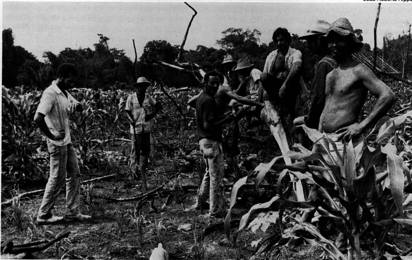
Posseiros na Gleba Curral da Pedra, Conceição do Araguaia – Pará

Está-se diante de pequenos produtores agrícolas, que compõem unidades de trabalho familiar, detentores de benfeitorias, roçados e animais de tração. Não se encontram subordinados por modalidades de trabalho assalariado. Constituem-se em “camponeses livres”, que abriram áreas próprias de cultivo em terras devolutas e disponíveis, à margem das grandes explorações agropecuárias. Mantém ligações com os circuitos de mercado de produtos agrícolas independentemente de “plantations”, agroindústrias ou projetos pecuaristas. Através do processo de ocupação das chamadas “terras livres” da Amazônia, adquiriram capacidade econômica e operacional para suportarem pressões e travarem confrontos prolongados, ainda que técnica e bélicamente desiguais. Observe-se que, nos conflitos de terra na Amazônia, a sofisticação técnica pode não superar obstáculos naturais como a densidade das florestas e as chuvas abundantes. Isto pode levar os que detêm instrumentos mais rústicos,