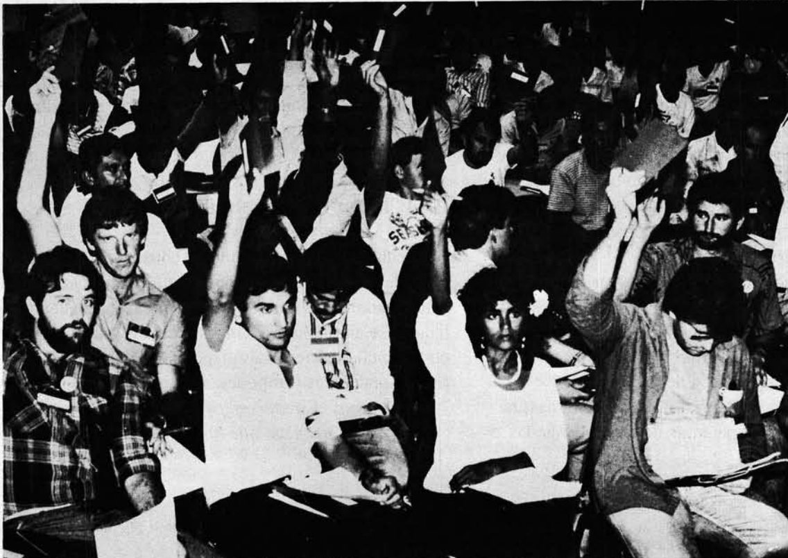
I Congresso do DNTR/CUT, Votação em plenária